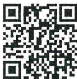
แบบสำรวจฯ