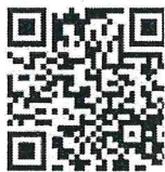
สิ่งที่ส่งมาด้วย